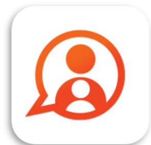
Konnect OuderApp Konnect B.V.

Tevens kunnen er in de app foto's van je kind gedeeld worden. De handleiding voor de app is op te vragen bij de pedagogisch medewerker en is te vinden op de website onder documenten. www.sopoh.nl/bso .