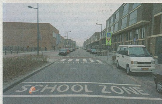
Niemand kan straks over het hoofd zien dat hij of zij een schoolzone binnenrijdt.

Ouders en leerkrachten van de scholen in Toolenburg-West, Skagerak, Van den Berghlaan en Wormerstraat in Hoofddorp en Kalslagerring, Ridderspoor- en